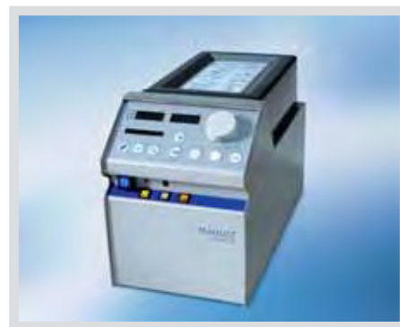
Система центрифужного насоса ROTAFLOW может также использоваться в качестве полностью независимого, автономного модуля