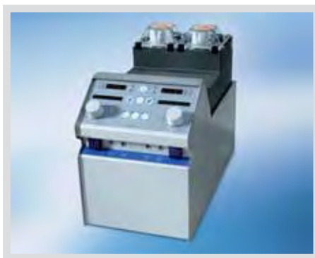
Двойной модуль насосов