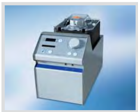
Одинарный модуль роликового насоса